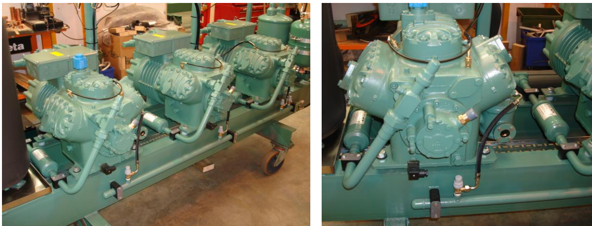
Figura 3: Detalhe da mufla instalada na descarga de cada compressor no rack de refrigeração.

É extremamente recomendada a utilização da mufla + eliminador de vibração para sistemas aplicados com refrigerantes que proporcionam altas pressões de trabalho, como por exemplo, o R404A, R507A, R410A, etc, tanto para compressores de simples como para os de duplo estágio de compressão.