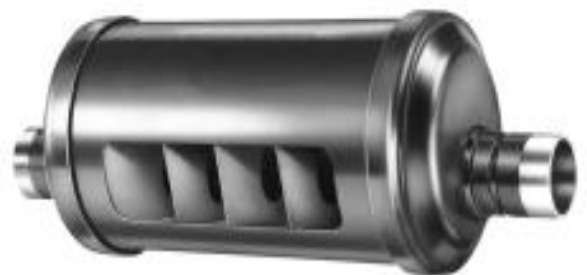
Figura 1: Detalhe da Mufla

A função da mufla é reduzir o ruído provocado pelas pulsações do gás da descarga permitindo a expansão no interior de suas câmaras. As muflas são dotadas de defletores internos projetados para uma mínima perda de carga. Esses defletores mudam a velocidade e a direção do gás da descarga que passa através da mufla, resultando num efeito de amortecimento das ondas de som de alta frequência dos gases em compressores de alta rotação. A mufla também diminui as ondas de pulsação em compressores de baixa rotação.